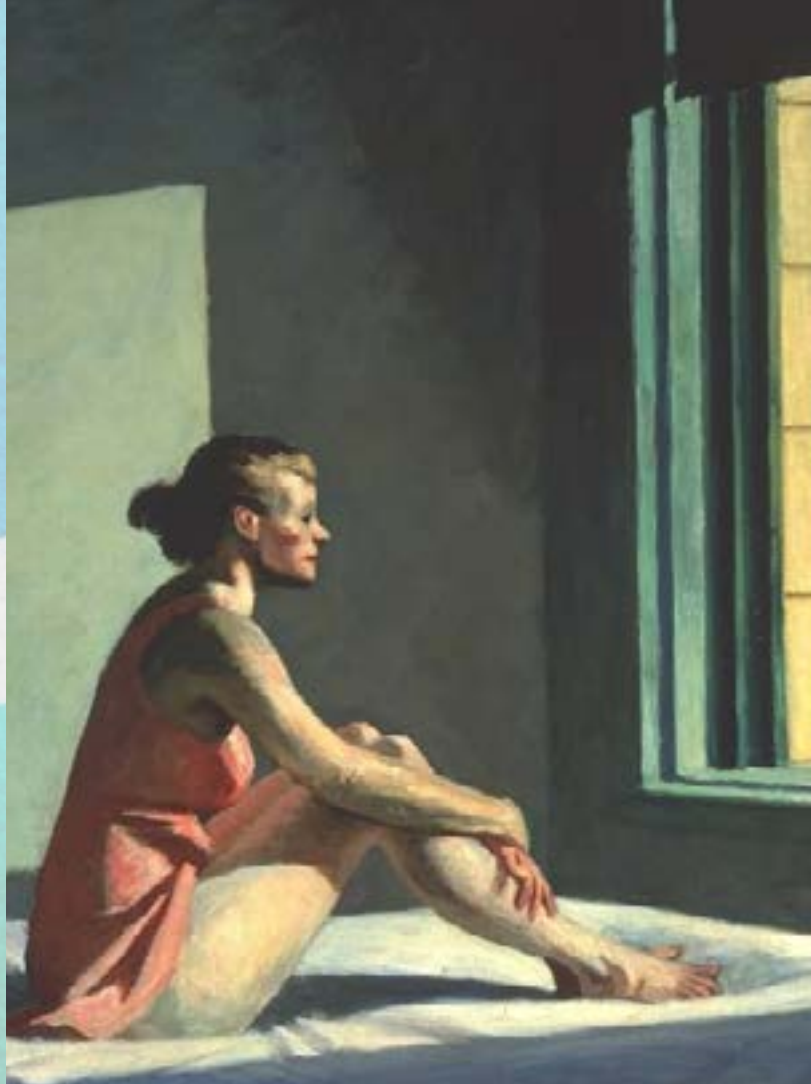
Edward Hopper, Morning Sun