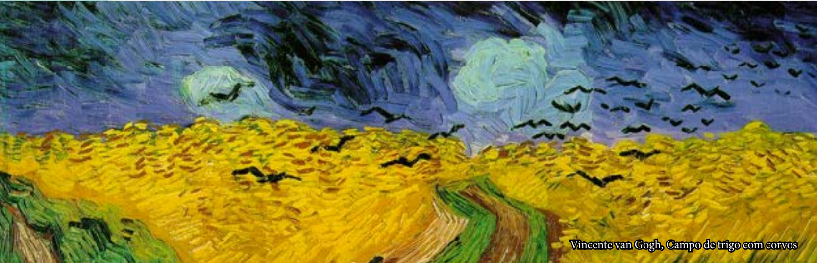
Vincente van Gogh, Campo de trigo com corvos

O Alentejo tem riqueza e simplicidade que são características singulares desta zona do país e são estes pormenores que encantam toda a gente que a visita.