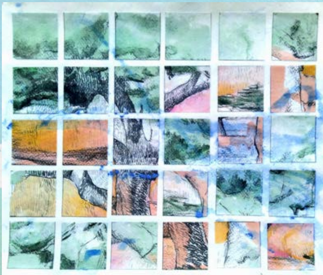
Ínsulo sul técnica mista sobre papel 29x24 cm 2019